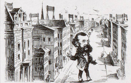
Freuler: «Merkwürdig, Zürich stimmte gegen die Todesstrafe und nun hat es doch auf jedem Hause einen Galgen! Wie sich die Menschen ändern!»