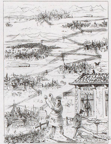
Hoteller: «Da haben wir nun die Bescherung in Folge des Schimplens. Die Kommissionler stellen sich inskünftig einfach vor das eidgenössische Kommissionstelephon und machen die Geschäfte hübsch zu Hause ab. Und unsereins soll nie was haben!» – Die Kellner: «Und wir a nitt!»