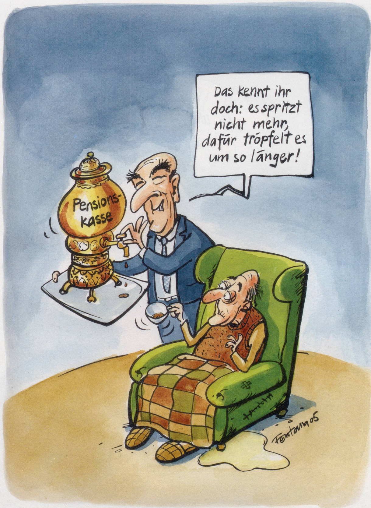
Länger leben mit weniger Rente. Der Bundesrat will den Umwandlungssatz der Pensionskassen von 7,2% auf 6,4% senken.