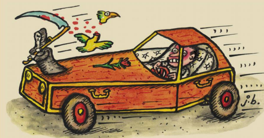
Das schnittige Raser-Auto