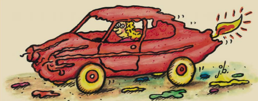
Das abbaubare Stearin-Auto