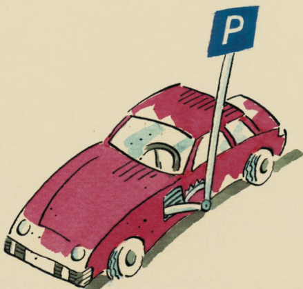
Modell „Scherzo“ (mit integriertem Parkplatzschild)