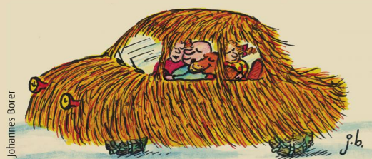
Das kuschelige Winter-Auto