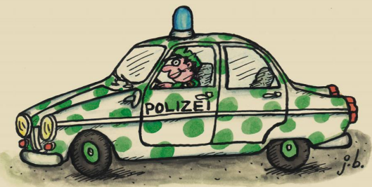
Der gepunktete Streifenwagen