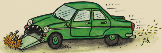
Das umweltfreundliche Biogas-Auto