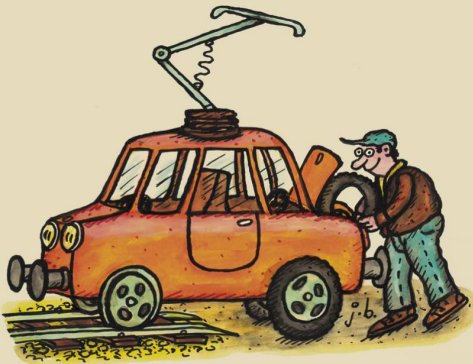
Das bahnt-compatible Elektro-Auto