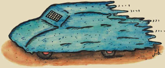
Das arabische Burka-Auto