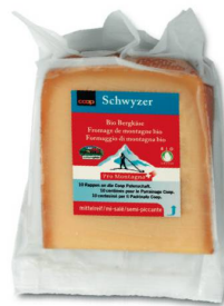
Coop Pro Montagna Schwyzer Bio-Bergkäse* per 100 g 2.30