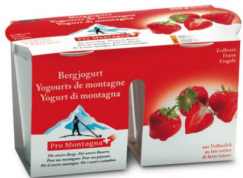
Coop Pro Montagna Bergjogurt Erdbeer* 2 x 175 g 1.85

* Erhältlich in grösseren Coop Supermärkten.