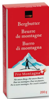
Coop Pro Montagna Bergbutter* 200 g 3.30