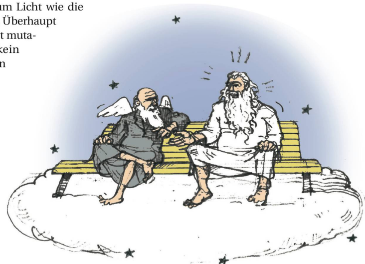
Seit Darwins Eintritt in den Himmel ist er dort unseres Herrgotts «special guest»: endlich hatte er einen interessanten Gesprächspartner gefunden!

Zusammenfassend lässt sich also sagen, dass bis heute keine schlüssige Theorie existiert, von wem oder was wir abstammen. Die Klärung dieser Frage ist genauso interessant und nervenaufreibend wie die Jodeltechnik der Aka-Pygmäen in Zentralafrika. Wir wissen nicht viel. Wir wissen nur, dass Darwin einen Vogel und Gott versagt hat. Wie unsere Politiker. Was wissen die schon von Nächstenliebe?