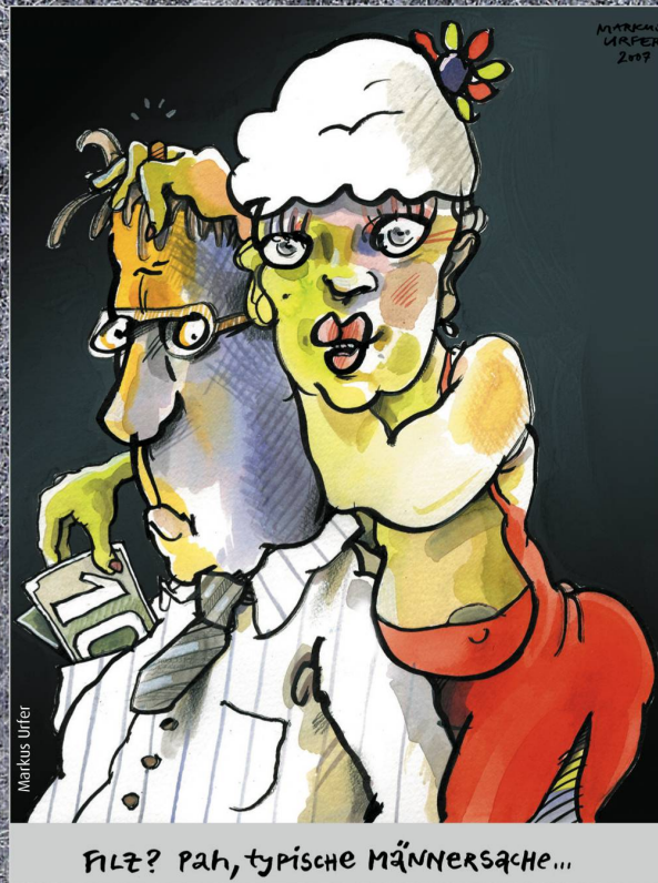
FILZ? Pah, typische MÄNNERSACHE...