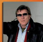
Roots66 & Polo Hofer