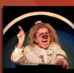
Gardi Hutter «Die Souffleuse»