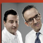
Schlatter & Frey «Der beliebte Bruder»