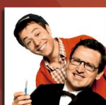
Duo Lapsus «Bäumig»