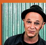
Blues Max «Endlich Popstar»