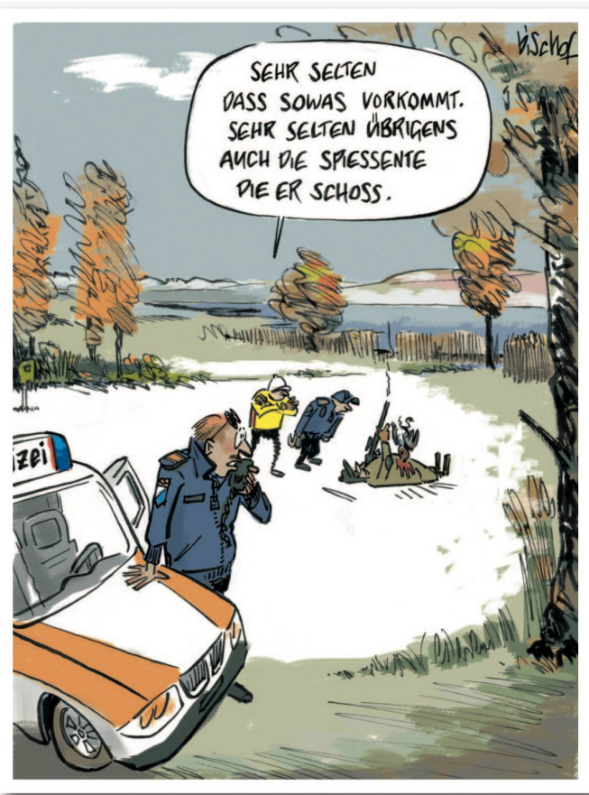
CARTOONS: NICOLAS BISCHOF