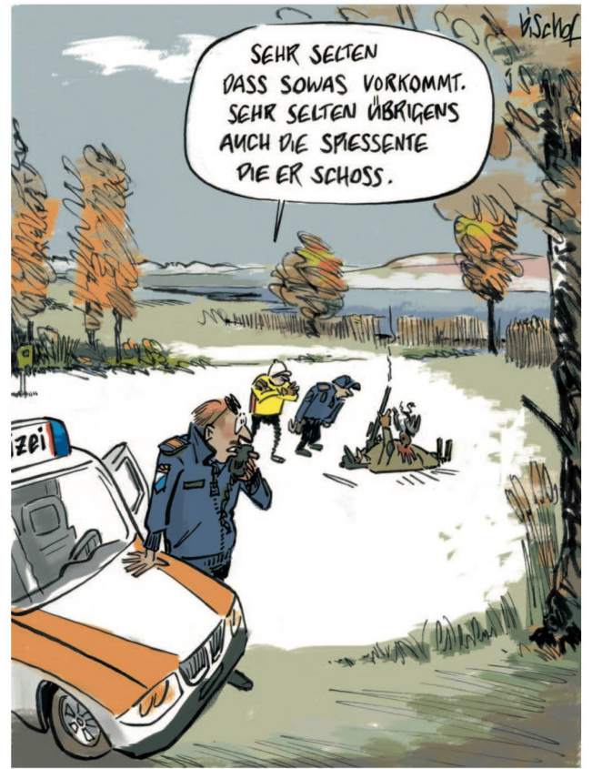
CARTOONS: NICOLAS BISCHOF