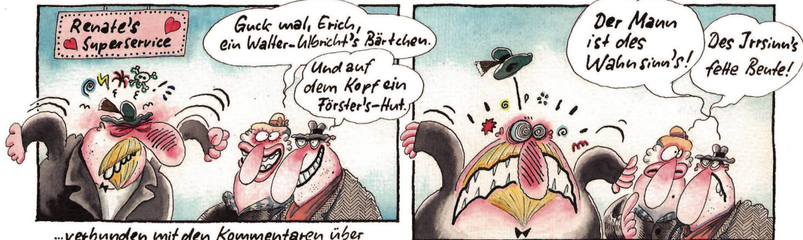
...verbunden mit den Kommentaren über seinen (Walter-Lalbricht-) Spitzbart...