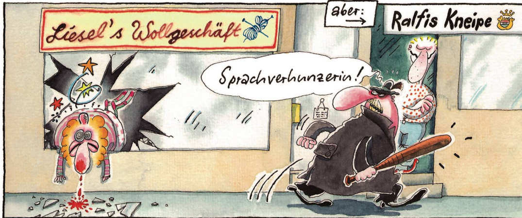
... hinterlässt er eine Spur der Zerstörung!