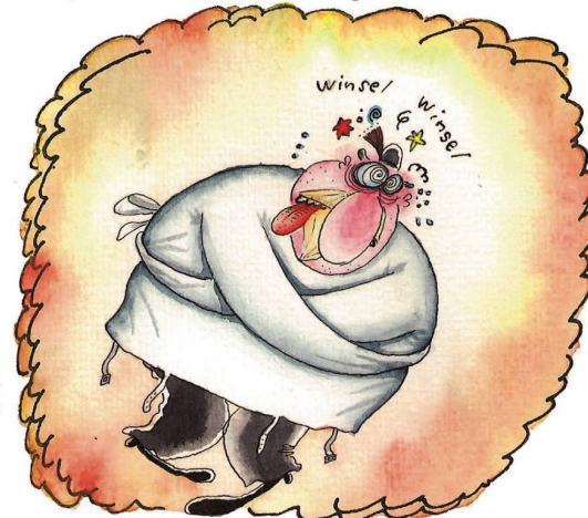
Eine Reise in die Ex-DDR wird ihm schliesslich zum Verhängnis.