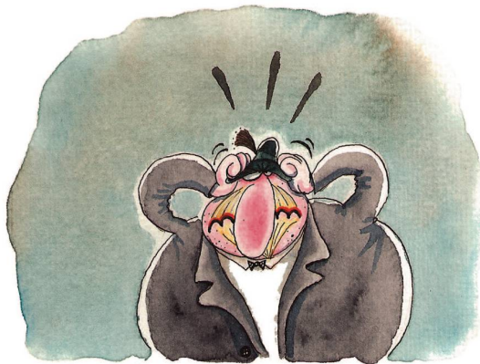
Mein alter Deutschlehrer hasst nichts so sehr, wie Anglizismen in der deutschen Sprache.