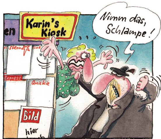
Überall, wo er den falschen „englischen“ Genitiv entdeckt...