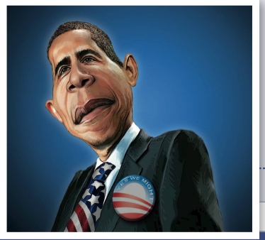
Jürgen Tomicek | Deutschland Merkel auf den Schild gehoben. Petar Pismestrovic, Kleine Zeitung | Österreich Neue Fahrgemeinschaft in Frankreich Shlomo Cohen | Israel Yes we might.