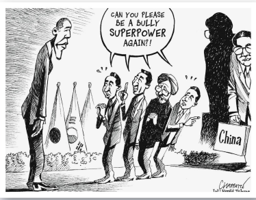
Patrick Chappatte, International Herald Tribune «Könnten Sie bitte wieder eine bedrohliche Supermacht werden?»