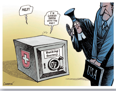
Patrick Chappatte | Le Temps «Hilfe, ich hab mich mit dem Schlüssel eingeschlossen!»