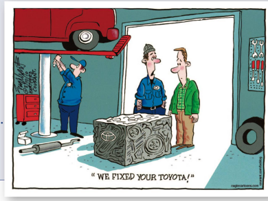
Bob Englehart | Hartford Courant «Wir haben die Probleme mit Ihrem Toyota gelöst.»