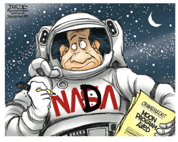
John Cole | The Scranton Times Obama stützt Nasa-Programme.