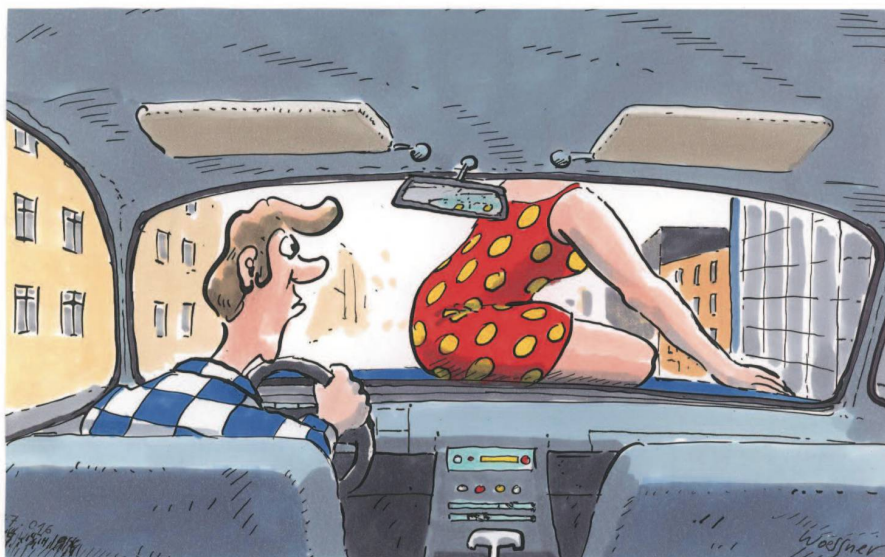
...war in der täglichen Fahrpraxis dann doch eher hinderlich.

nale wird ein letztes Mal ein Hupkonzert einsetzen und schauerlich durch die Landschaft dröhnen, dann immer leiser werden und schliesslich ganz ersterben. Einige Autofahrer werden vor Verzweiflung gegen das geliebte Blech treten, davon aber bald mangels geeigneten Schuhwerks wieder ablassen. Ein paar werden versuchen, die Leitplanken aufzureissen, um sich übers Feld davonzumachen, jedoch zumeist im Erdreich stecken bleiben.