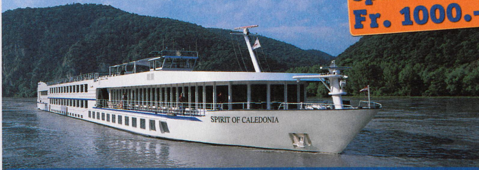
Budapest – Passau – Basel mit MS Spirit of Caledonia ****

15 Tage ab nur Fr. 1990.- (Rabatt von Fr. 1000.- bereits abgezogen)