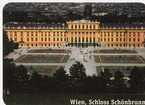
Wien, Schloss Schönbrunn