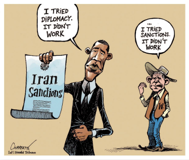
Patrick Chappatte International Herald Tribune Diplomatie versus Sanktionen Rainer Hachfeld Neues Deutschland Die Entdeckung ungeheurer Bodenschätze