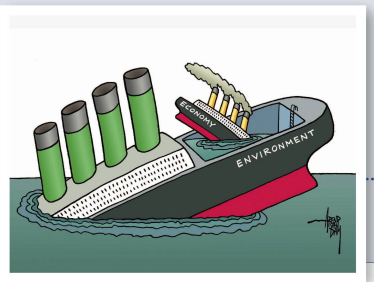
Nate Beeler The Washington Examiner Der liebste Sport der Welt (-politik) Arend van Dam | Niederlande Die doppelte Titanic