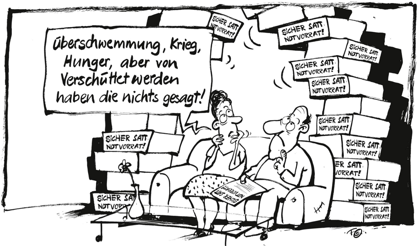
Das Zürcher Unternehmen «Sicher Satt AG» warnt wegen globaler Krisen vor Versorgungsengpässen und verkauft teure, vakuumverpackte Notvorratspakete .