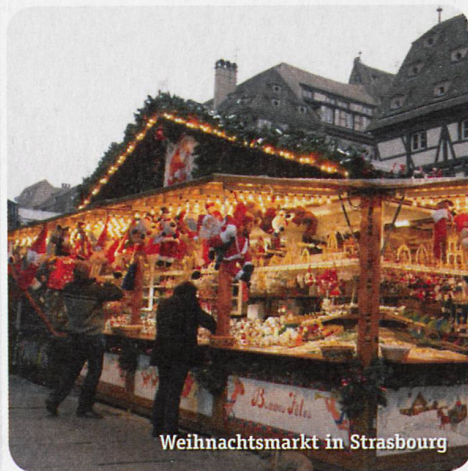
Weihnachtsmarkt in Strasbourg

Gleiche Reise in umgekehrter Reihenfolge.