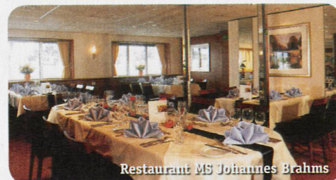
Restaurant MS Johannes Brahms

Auf diesem sehr komfortablen Schiff finden max. 80 Personen in 40 Kabinen Platz. Alle Kabinen liegen aussen, sind mit grossen Panoramafenstern, zwei unteren Betten, Dusche/WC, Fön, Telefon, TV, Minibar, Safe und Klimaanlage ausgestattet. Zur Bordausstattung gehören Restaurant, grosszügige Lounge und Sonnendeck. Nichtraucherschiff (Rauchen auf dem Sonnendeck erlaubt).