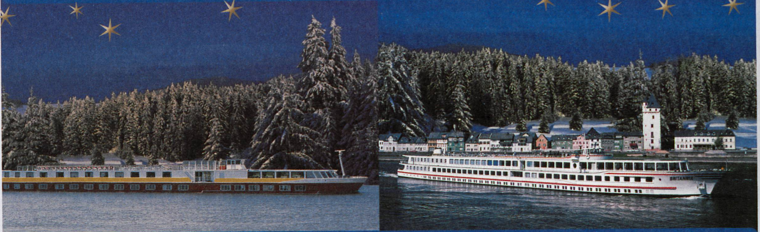
MS Johannes Brahms****