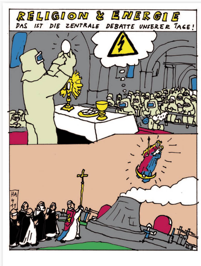
Da wie dort: Furcht und Faszination des Unsichtbaren