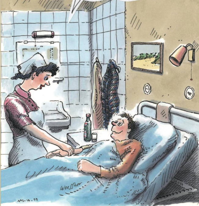
Am Puls der Zeit