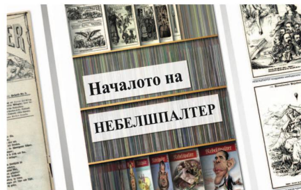
So liest sich der Titel «Die Anfänge des Nebelspalter» in kyrillischer Schrift.