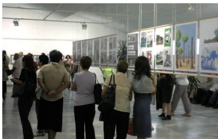
Blick in den Saal der «Nebelspalter»-Ausstellung im vierstöckigen Haus für Satire und Humor.