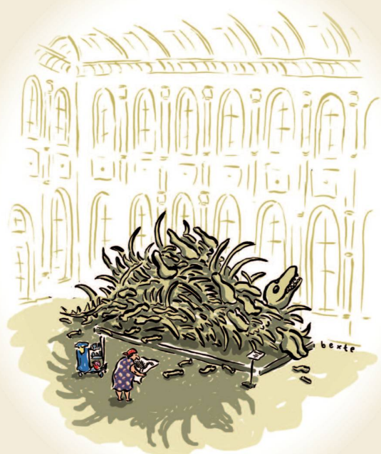
Fluch der Akribik 2