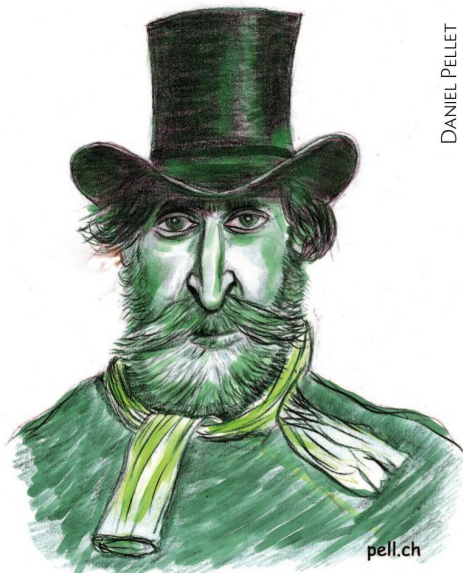
Undatiertes Porträt des grossen Giuseppe Verdi, als dieser sich einmal grün geärgert hatte.

G iuseppina hiess seine zweite Frau: G+G wie heute für Glanz und Gloria.