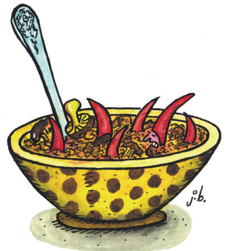
Ungarisches Pilz-Gulasch mit pikanten Chili-Zwergen.