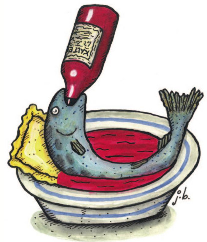
Forelle blau im südtiroler Kälterersee auf Ravioli-Kissen.