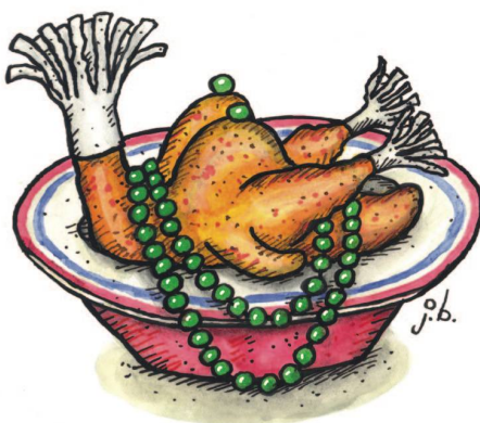
Gefüllte Perlhuhnbrust (kein Silikon) mit schottischer Erbsenkette.