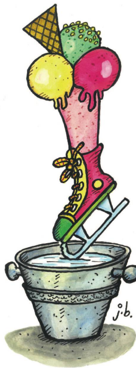
Deutsches Eisbein auf gefrorenem Nordsee-Wasser.