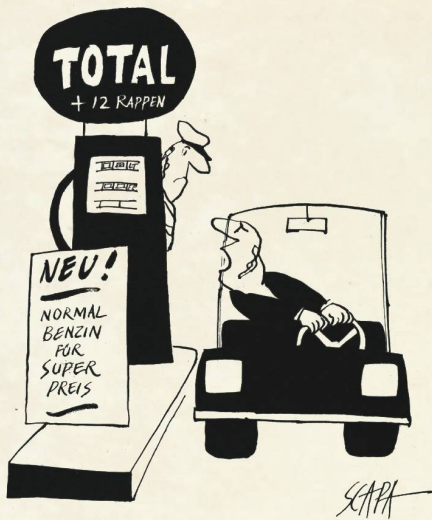
«Ihr seid ja total verrückt ...»