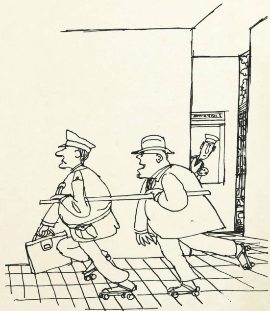
«... es spart Benzin, es hält mich warm und es bringt mich sogar fünf Minuten früher an Ort und Stelle als der Rolls!»

Ein Thema beherrschte die Medien in den ersten Monaten des Jahres 1974: die Ölkrise . Nachdem die OPEC die Fördermengen drosselte, um politischen Druck auf die westlichen Länder auszuüben, schossen die