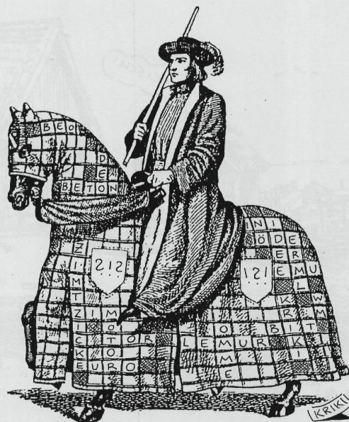
DIE KREUZZÜGE WÄREN OHNE DIE KREUZWORTRÄTSELRITTER STINKLANGWEILIG GEWESEN.