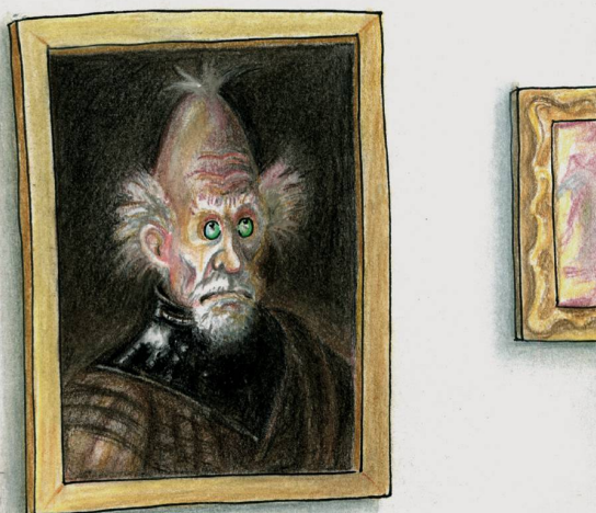
Der spektakulärste Kunstraub aller Zeiten!