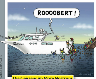
Die Geissens im Mare Nostrum