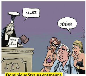
Dominique Strauss entspannt