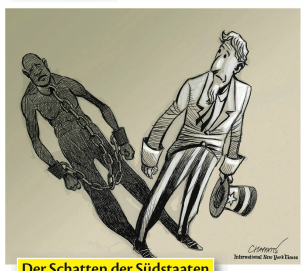
Der Schatten der Südstaaten