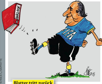
Blatter tritt zurück