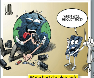
Wann hört das bloss auf?