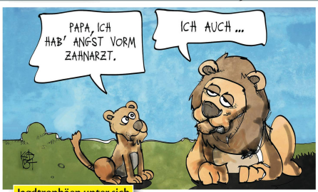
Jagdtrophäen unter sich