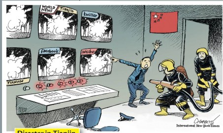
Disaster in Tianjin