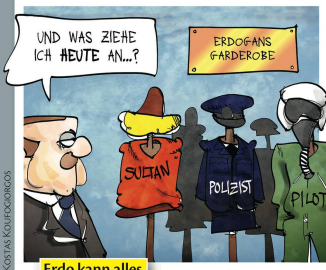
Erdo kann alles