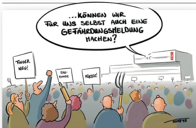
CARTOONS: TOMZ (TOM KÜNZLI)