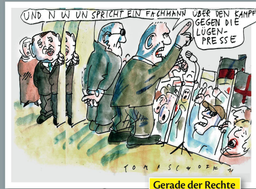
Gerade der Rechte