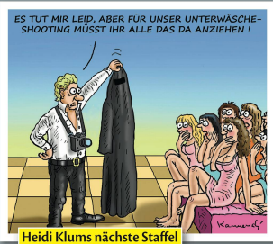
Heidi Klums nächste Staffel