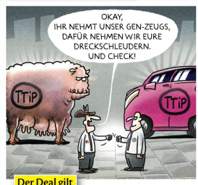
Der Deal gilt