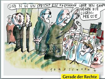
Gerade der Rechte