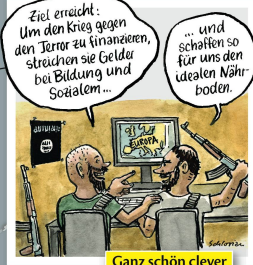
Ganz schön clever