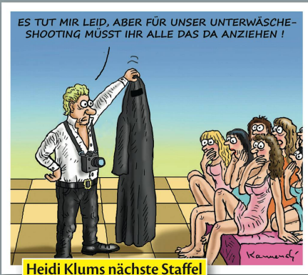
Heidi Klums nächste Staffell