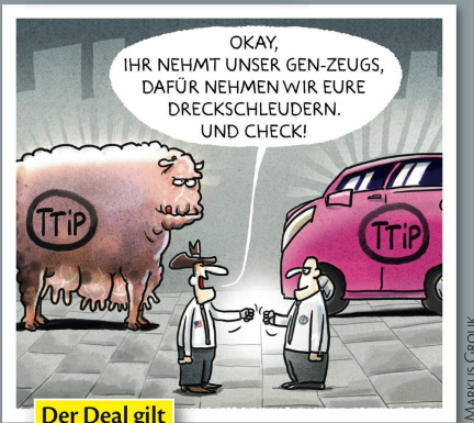
Der Deal gilt