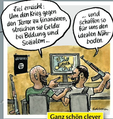
Ganz schön clever