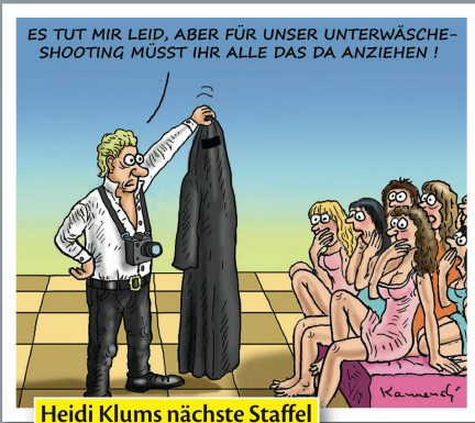
Heidi Klums nächste Staffel