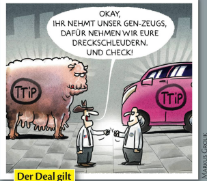
Der Deal gilt