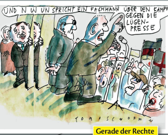
Gerade der Rechte