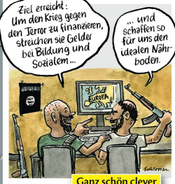
Ganz schön clever