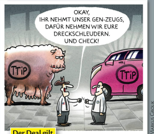
Der Deal gilt