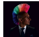
Anderer wiederum stellen sich unter der sogenannten Elite auserlesene Menschen vor, die gescheitert sind als andere.