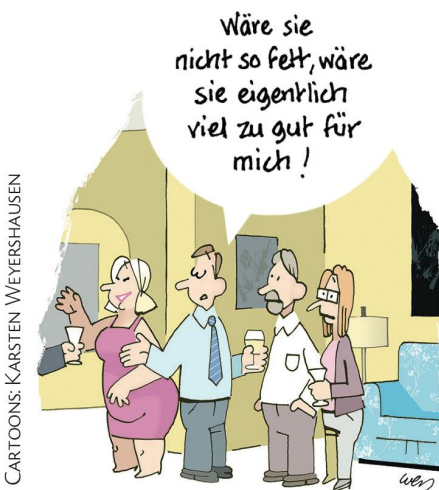
CARTOONS: KARSTEN WEYERSHAUSEN