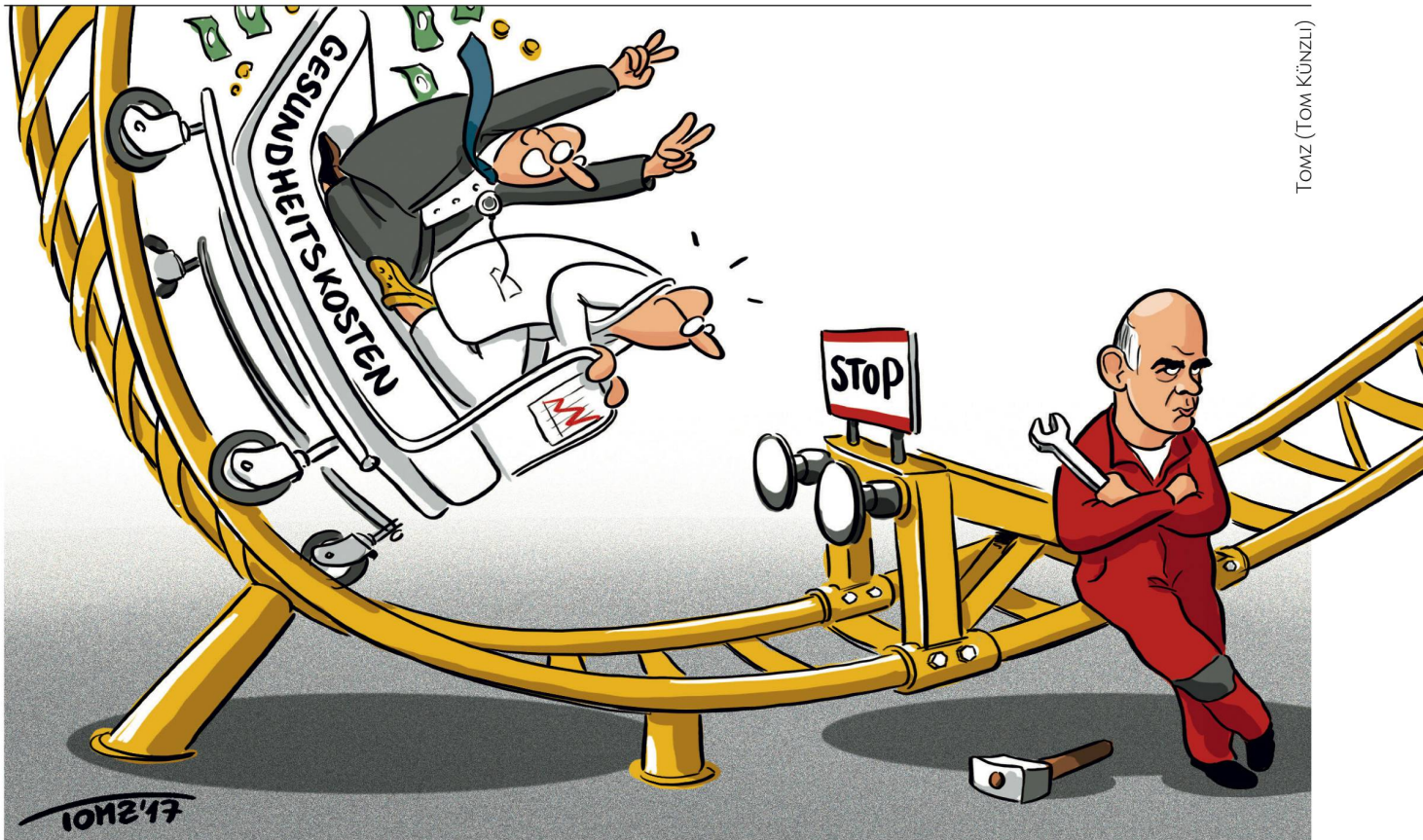
TOMZ (TOM KÜNZLI)

Teufelskreislauf durchbrechen: «Obwohl rational gesehen die Chance auf einen Gewinn minimal ist, glauben Abhängige fest an die Wirkung ihres Lottozettels.» (rs)