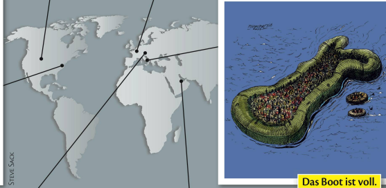
Das Boot ist voll.