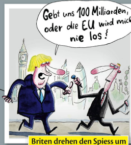
Briten drehen den Spieß um