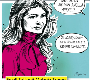
Small Talk mit Melania Trump