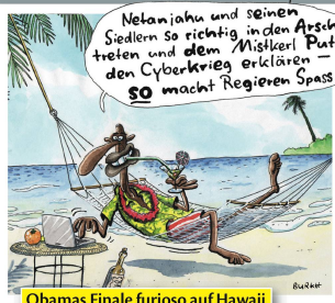
Obamas Finale furioso auf Hawaii