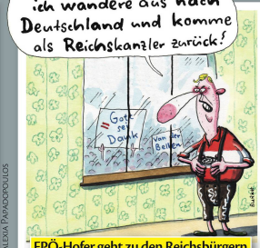
FPÖ-Hofer geht zu den Reichsbürgern