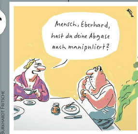
MOCKE (VORNER) KOSCHNICK