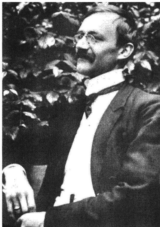
Karl Barth, 1916 in Safenwil