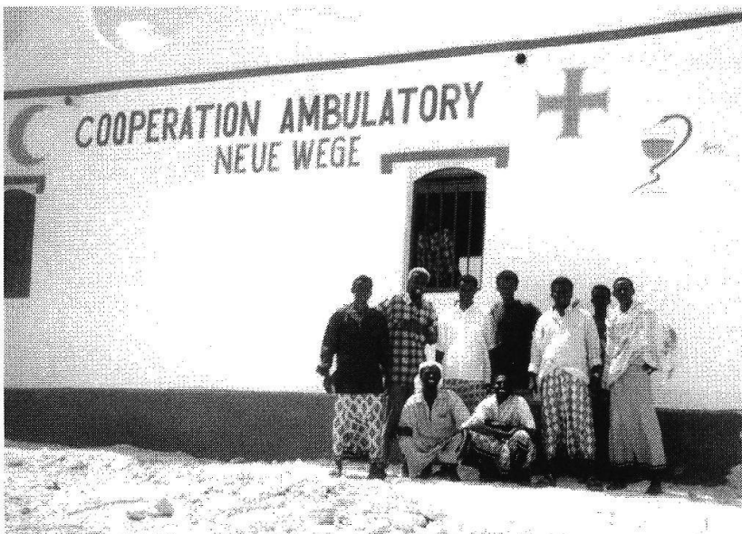
Ambulatorium im Armenviertel von Merka

bestanden haben, und eine Klasse B mit einer Probezeit von 6 Monaten für die 17, die nicht bestanden haben. Sie werden arbeiten, und in diesem Prozess können wir dann sehen, wer sich für die Mittelschule eignet; die Professoren bestehen darauf, dass sie dann nochmals eine Aufnahmeprüfung machen müssen, die Schüler sind einverstanden damit.