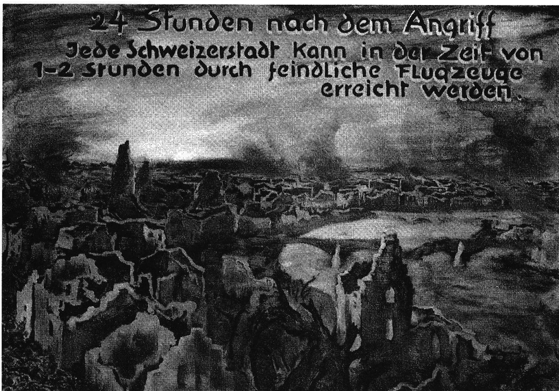
Visionäres Horrorbild aus den frühen 30er Jahren über die Zerstörung einer Stadt nach einem Bombenangriff aus der Luft.

Wie ist die Ausstellung mit den Bildern von Hedwig Scherrer damals aufgenommen worden? Von St. Gallen lässt sich Erfreuliches berichten. Es konnten nach einer halben Woche bereits tausend Besucher verzeichnet werden. Die grösste Zeitung der Stadt, das St. Galler Tagblatt, würdigte die Ausstellung mit einem aussergewöhnlich grossen Bericht, in dem es unter anderem hiess: «Den stärksten Eindruck vermitteln Bilder und Zahlen. Was für ein gefräßiges Ungeheuer ist der Krieg. Oder sagen wir: die Rüstungsindustrie. Die Bilder der Künstlerin Hedwig Scherrer sprechen eine sachliche und harte Sprache, die man sonst nicht zu vernehmen gewohnt ist.»