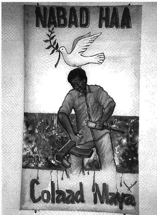
«Put the gun and take the pen» – Bildung statt Waffen.