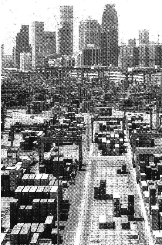
Welthandel gleich Reichtum – wie hier in Singapur? Die Rohstoffpreise sind rückläufig. (Bilder: Richard Gerster).

Sozialforscher haben ermittelt, dass in der Schweiz am meisten Spenden erhält, wer behinderten Kindern im Schweizer Berggebiet junge Blindenhunde schenkt. In diesem widrigen Umfeld möchten die