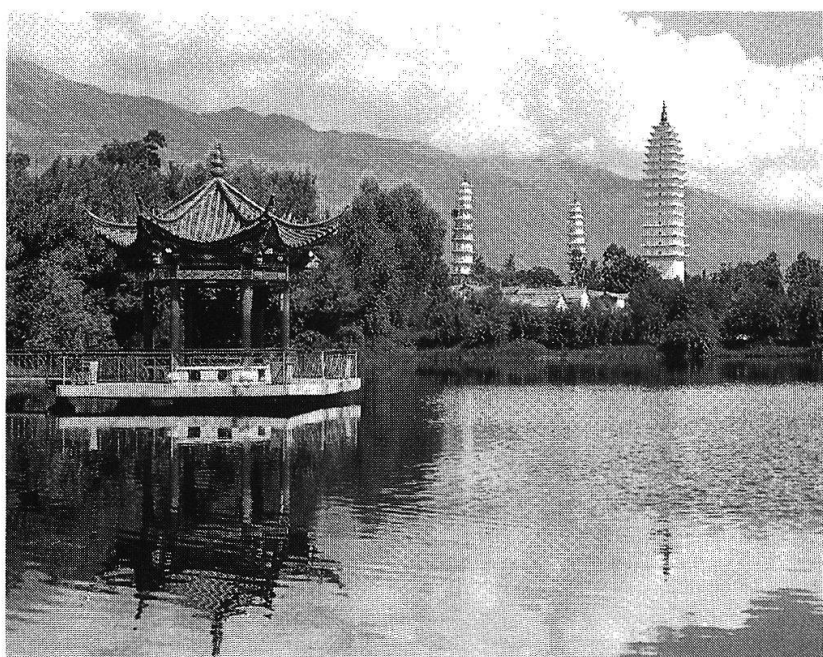
«Ex oriente lux». Der Urgrund der Esoterik ist östlich.

Wie alles zwei Seiten hat und somit Missbrauch offen steht, zeigt auch das Anliegen der amerikanischen Schwarzen mit ihrer Suche nach Wurzeln oder Roots . Mit Recht geht Esoterik der Fra-