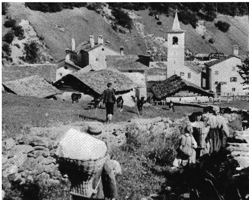
Aus dem Coop-Film «Wir bauen auf».