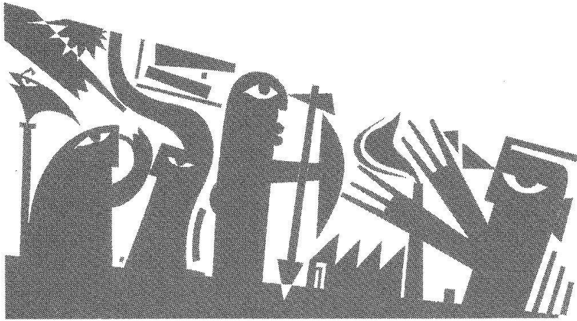
Wie werden Güter verteilt und verteidigt? (Archiv Baer: Scherenschnitte aus Namibia).

11. Bis vor kurzem schien es, als bekämen Frauen Kinder unabhängig davon, ob sie als Mütter in Würde leben können. Heute zeigt sich, dass dies nicht mehr der Fall ist: Immer mehr Frauen sind nicht mehr bereit, Mütter zu werden, wenn sie damit die Aufgabe ihres Berufs, ihrer gesellschaftlichen Anerkennung und Teilhabe und ihrer finanziellen Unabhängigkeit riskieren oder gar ein Armutsrisko eingehen. In einer Ge-