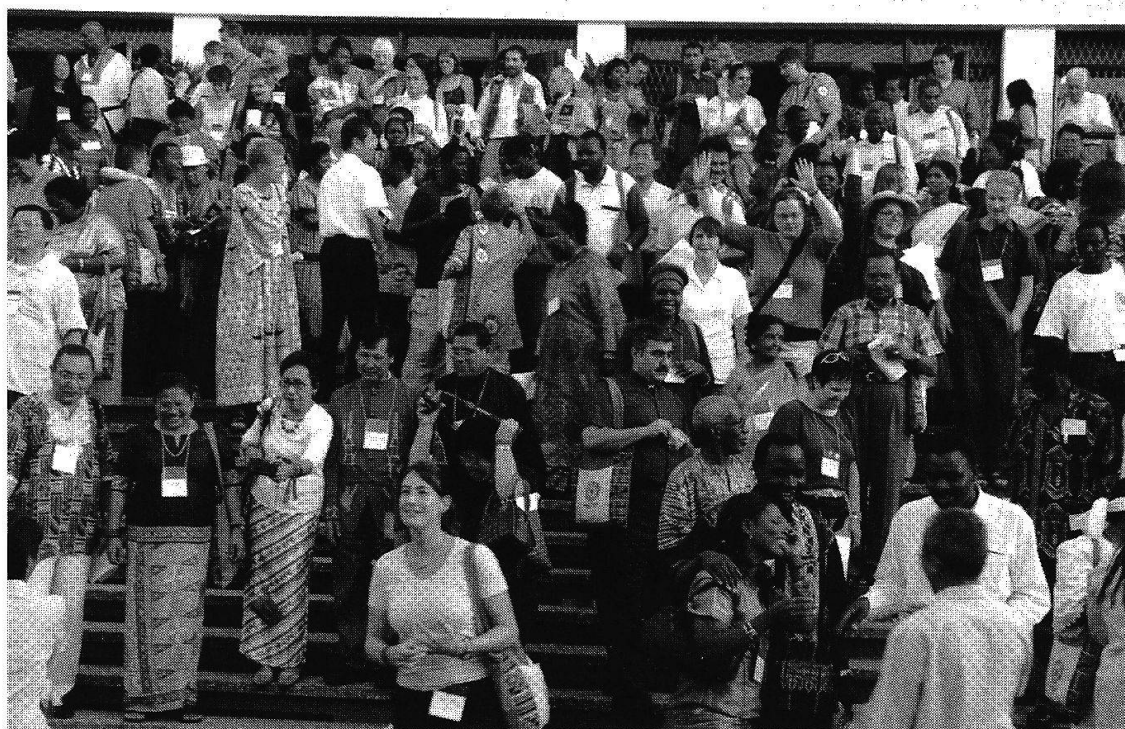
Delegierte: Die Mehrheit der Reformierten lebt im Süden.

Man kann im übrigen noch hinzufügen, dass Karl Barth nach dem Krieg ein Schulbekenntnis dafür ablegte, dass das Bekennen der Bekennenden Kirche nur