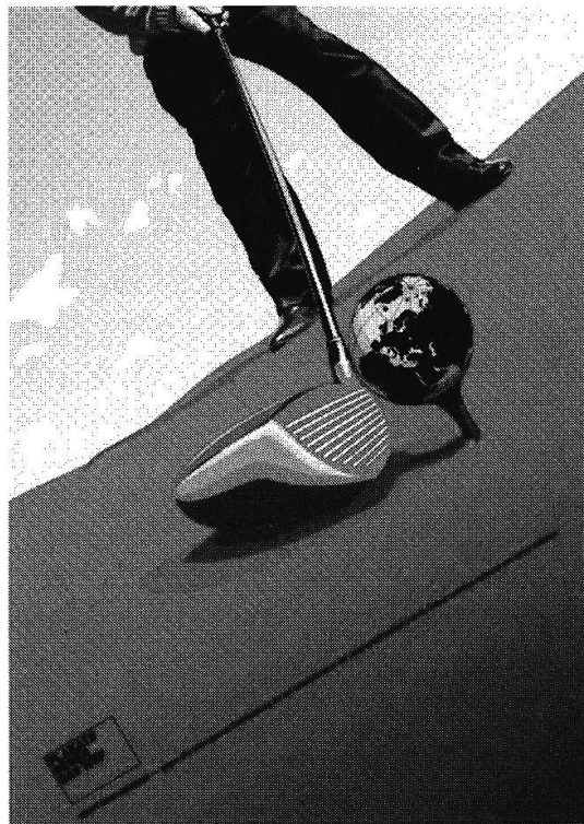
Alle Plakate aus der Serie «Plakate gegen das wef».

Hella Hoppe: Ich habe am Anfang von Reformen des globalen Wirtschaftssystems gesprochen. Ebenso gut hätte ich von der Bekämpfung der Machtungleichgewichte in diesem System sprechen können. Die WTO z.B. ist eine globale Institution, die zunehmend die Rahmenbedingungen für Unternehmen