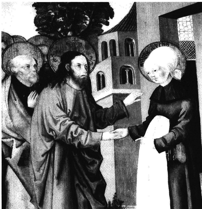
Martha als Gastgeberin Christi. Aus dem Bildzyklus des Marthaaaltars (1517) in der Nürnberger Lorenzkirche.

Maria hat «den guten Teil» erwählt (und nicht wie an vielen Orten falsch übersetzt: «den besseren Teil»). Marthas grosser Dienst wird nicht abgewertet. Hier gibt es allerdings viele Fragen: was ist der gute Teil , den Jesus hier anspricht? Steht eine Gemeinderealität hinter dieser Geschichte, die verschiedene Diakonieverständnisse verhandelt bzw. wertet? Geht es um die Abtrennung des Wort-Dienstes vom Tisch-Dienst (vgl. Apg 6)? Soll die lärmende Martha (die sich öffentlich engagiert) in einen Gegensatz zu Maria gesetzt werden, die schweigt? Vieles muss hier noch erforscht werden oder auch offen bleiben.