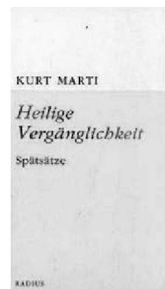
Kurt Marti: Heilige Vergänglichkeit. Spätsätze. Radius Verlag 2010. 48 Seiten.